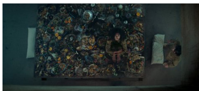
Figura 2: La plataforma de comida

Esto se ve reflejado en cómo trata el personaje la comida: la manipula con desprecio, escupe sobre los restos e insulta a los siguientes cuando la plataforma baja. Justifica esto aduciendo que “los de arriba” han hecho lo mismo antes que él, con lo que él participa de la cadena en la que el más fuerte oprime al que es más débil.